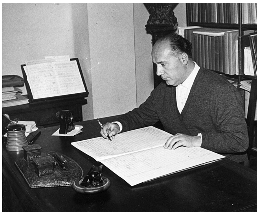
Zarauzko bulegoan, lanean, 1960. hamarkadan. ERESBIL