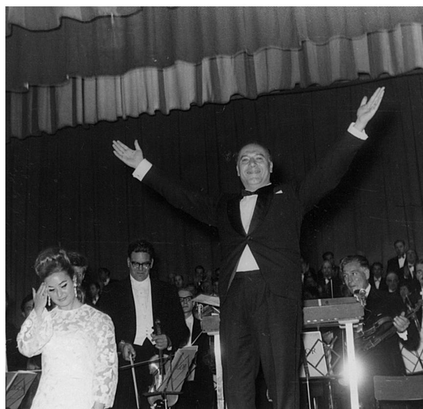
Zigor! obra 1967an estreinatu zuen Bilbon. Irudian, ikusleak agurtzen. ERESBIL