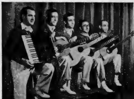
Los Ruiseñores del Norte