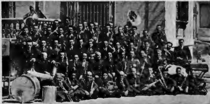
Banda de la 1.ª Legión de Tropas de Aviación