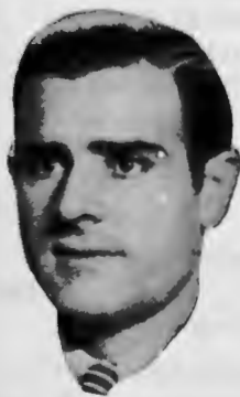
Niño de Vélez