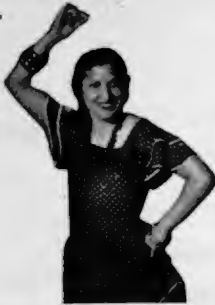
Nuncha de Aragón