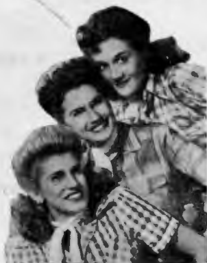
The Andrews Sisters