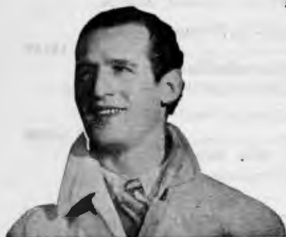
Manolo El Malagueño