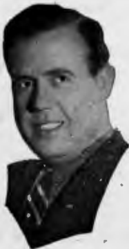
Canalejas de Puerto Real