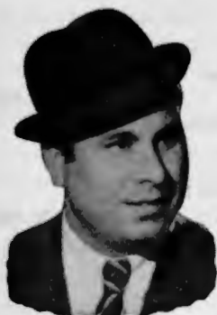
Niño de la Calzada