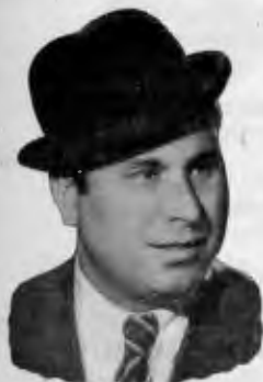
Niño de la Calzada