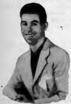
Niño de la Ribera