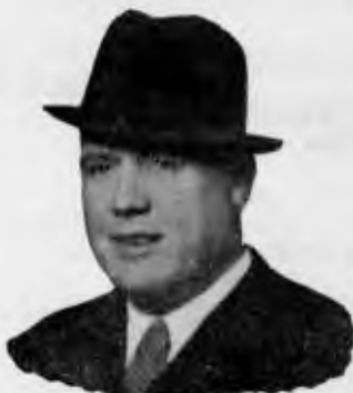
Canalejas de Puerto Real