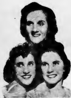
The Andrew Sisters

THE ANDREW SISTERS. (Acompañadas por Vic Shoen y su Orquesta).