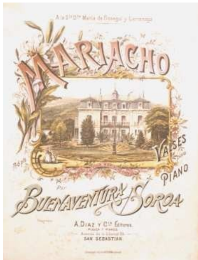
Partitura editada en San Sebastián por la casa A. Diaz y Cia.

Editorial de partituras que funcionó en San Sebastián desde finales del siglo XIX hasta mediados del s.XX. Se adquirió la colección de partituras que estaban a la venta cuando se cerró la casa. Aproximadamente unas 7.000 partituras, de las que unas 3.000 pueden estar repetidas, componen la colección en la que destaca la música de piano, y la zarzuela. En esta editorial se editaron numerosas partituras de compositores vascos.