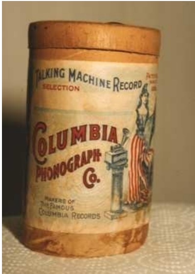
31. Contenedor de cartón de un cilindro de cera editado por la firma Columbia Phonograph.

Colección de 551 cilindros de cera pertenecientes a la familia vizcaína Ybarra. El fondo llegó en un pésimo estado de conservación, quedando totalmente inutilizados un centenar de cilindros. El contenido musical abarca los géneros de ópera, zarzuela, canción española y canción vasca.