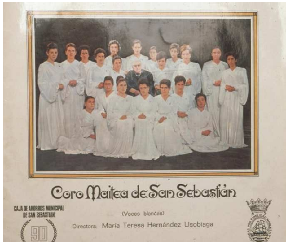
Carátula de disco de vinilo del Coro Maitea (1968).

Nº de fondo: A2. Modo ingreso: Cesión. Procedencia: San Sebastián.