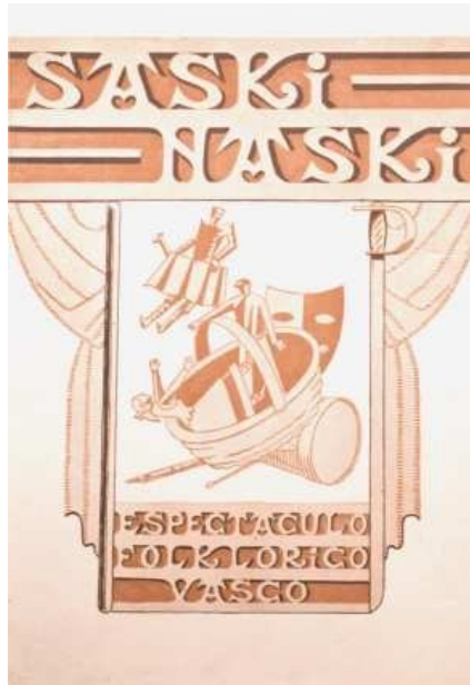
Boceto de vestuario del espectáculo Saski-Naski (Buenos Aires, c.1950).