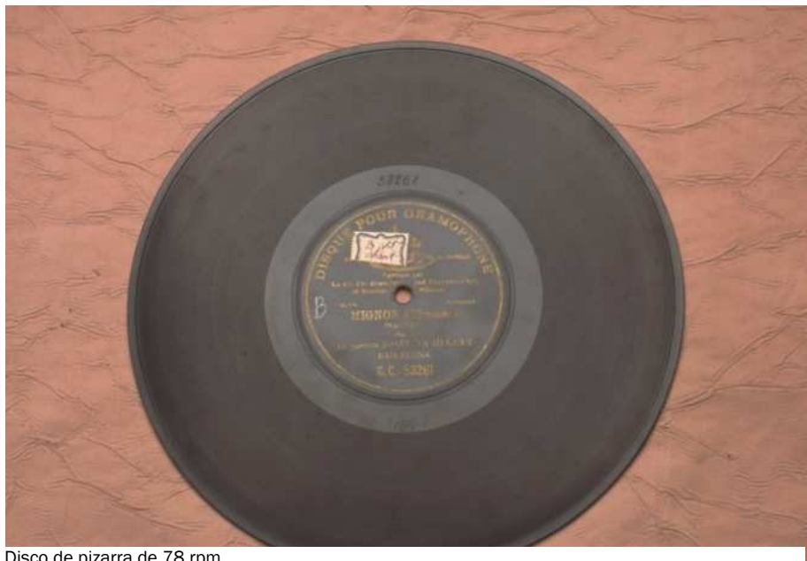
Disco de pizarra de 78 rpm.