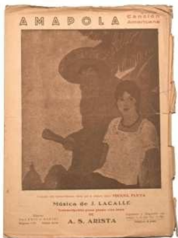
Música de salón utilizada por la Orquestina F. Arregui.

Nº de fondo: A49. Modo ingreso: Donación. Procedencia: San Sebastián