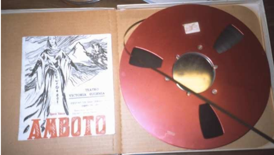
Programa y grabación de la ópera "Amboto".