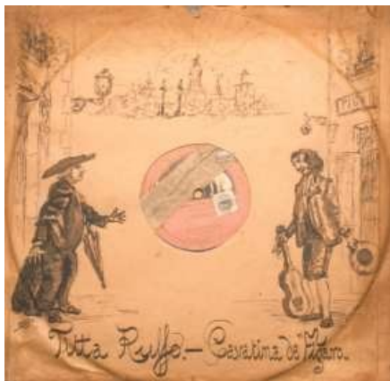
Carátula de disco de 78 rpm ilustrada a mano por Vicente Cobreros (1920).

Nº de fondo: A26. Modo ingreso: Donación. Procedencia: Errenteria