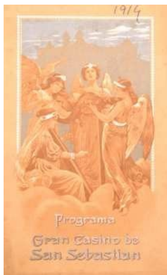
Programa de mano del Gran Casino de San Sebastián (1914).