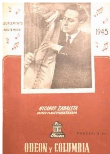
Suplemento discográfico de las casas Odeón y Columbia (Santiago de Chile, 1945).

Nicanor Zabaleta Zala (San Sebastián, 1907 – Puerto Rico, 1993), inició el estudio del arpa en el Real Conservatorio de Música de Madrid, continuado en París. Dió comienzo a su carrera concertística en Madrid, y trasladado a Nueva York, desarrolló una inmensa actividad de giras artísticas por los cinco continentes. Importantes compositores le dedicaron obras, convirtiéndose en uno de los impulsores del instrumento.